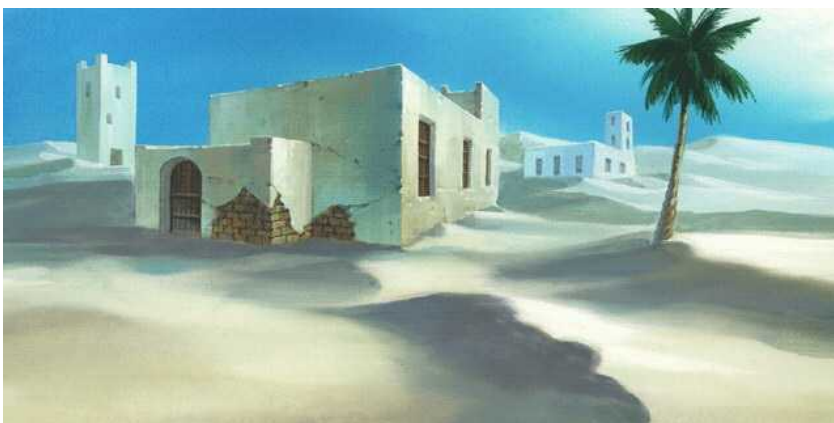
砂岩の地形イメージ