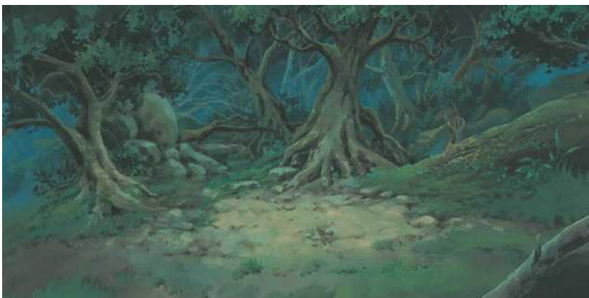
新緑の地形イメージ