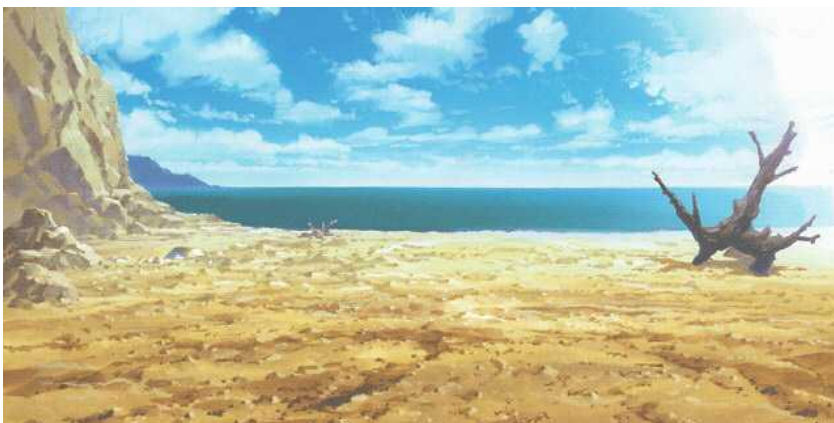
流水の地形イメージ